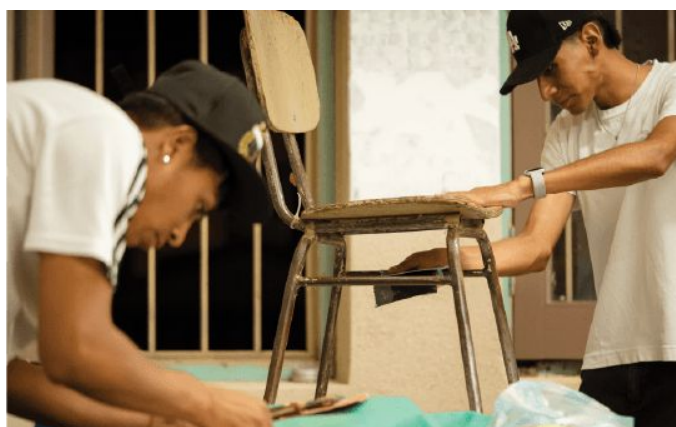
Santiago del Estero